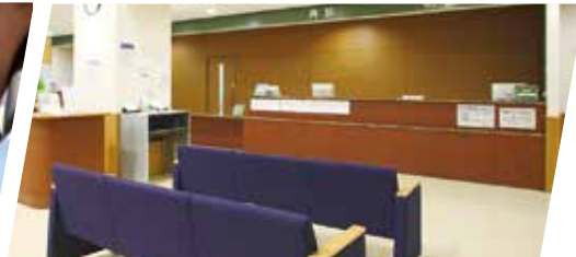
伊東内科クリニック 様