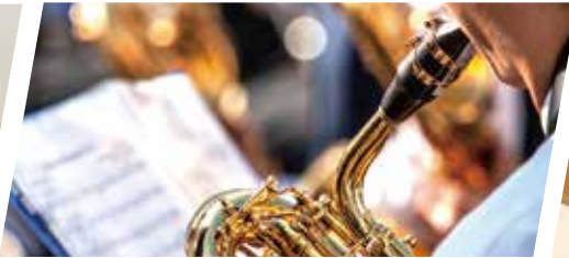
名古屋音楽大学 様