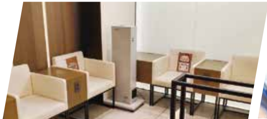
中部国際空港セントレア 様